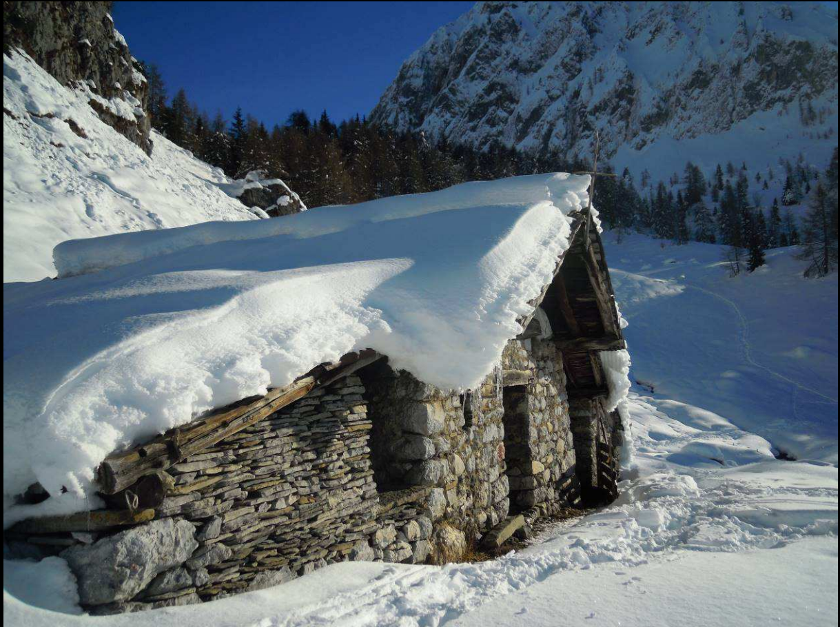
Baita di Mezzo di Vigna Vaga